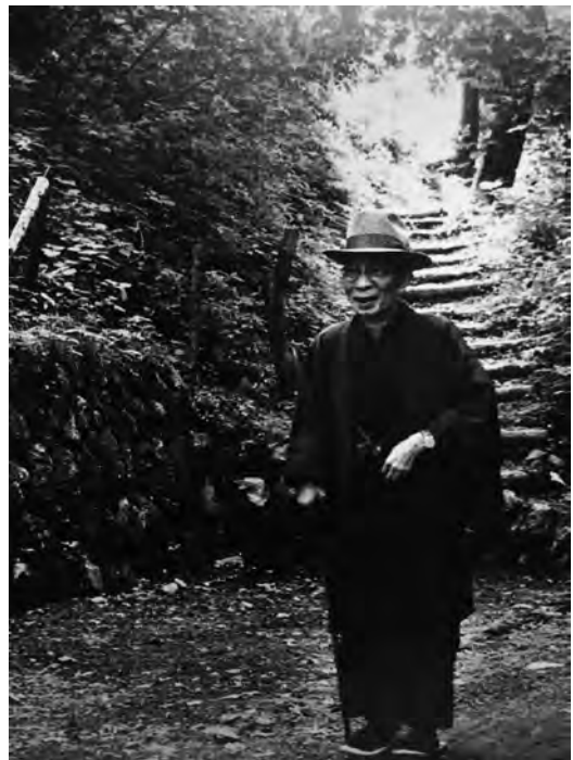
室生犀星 軽井沢の山道を歩く 1955 年頃