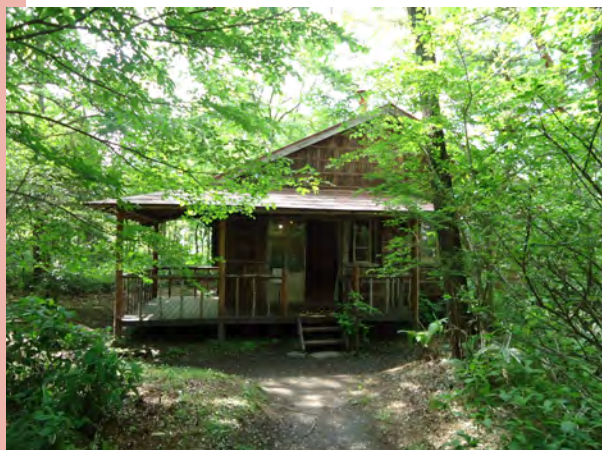
堀辰雄 1412 番山荘 (当館敷地内に移築。内部も公開しています)

日本の中の西洋であった軽井沢は、明治以降、多くの文学者により文学作品に描かれてきました。