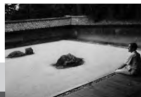
京都・竜安寺石庭の前に