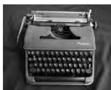
愛用のタイプライター 軽井沢山荘において『徒然草』英訳をはじめ多くの仕事を行った。東京都北区立中央図書館蔵

本展は、ドナルド・キーンが生誕100年を機に、夏の仕事場のあったゆかりの地において、主要作品や軽井沢との関わりなどを中心に、ドナルド・キーンの人と仕事を紹介しようとするものです。自筆原稿や書簡、蔵書、愛用品など関係資料約200点を展覧いたします。