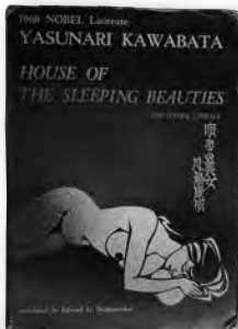
川端康成からドナルド・キーンに贈呈された川端康成『眠れる美女』英語版(エドワードD.サイデンステッカー訳)『House of The Sleeping Beauties and Other Stories』Kodansha International 1969年