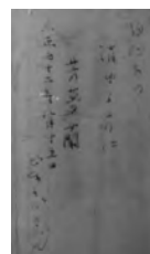
自作の俳句「白たまの 消ゆる方に 芳夢蘭 大正七十二年八月十五日 どなるどきん」。永井道雄の軽井沢山荘で甲子園野球TV番組を見ていた際、戯れにメモ用紙に赤ペンで記した句。「芳夢蘭」はホームランの当て字。大正七十二年(註:1983年)とあるのもユーモアが感じられる。