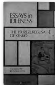
ドナルド・キーン英訳『徒然草』 『Essays in Idleness: The Tsurezuregusa of Kenko』Columbia University Press 1967年 D.キーンは「私の翻訳の中でも最高作と自賛できる英訳」と述べている。