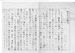
「軽井沢の魅力」原稿(冒頭) 1985年8月。後に『二つの母国に生きて』(1987年、朝日新聞社)に収録。「別荘とその周囲に相当の愛着を感じている」と記す。軽井沢は「日本で初めて住民票を持った記念すべき、愛すべきところ」という(キーン誠己「素顔の父ドナルド・キーン……ともに暮らして」/『新潟日報』2015年8月27日)