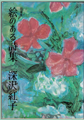
深沢紅子『絵のある詩集』

1974年、熊谷印刷出版部 深沢紅子が交友のあった堀辰雄、立原道造らについて記した随筆を収める