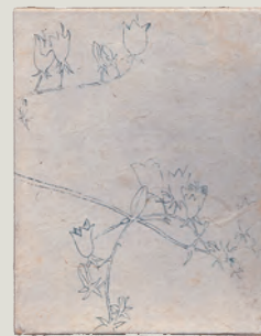
津村信夫『愛する神の歌』